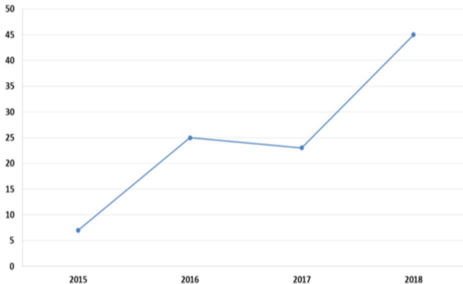
Количество зарегистрированных преступлений по ст. 128.1 УК РФ за период с 2015 по 2018 гг.

Изучение сведений, полученных в Информационном центре ГУ МВД России по Алтайскому краю, показывает значительный рост зарегистрированных преступлений по ст. 128.1 УК РФ.