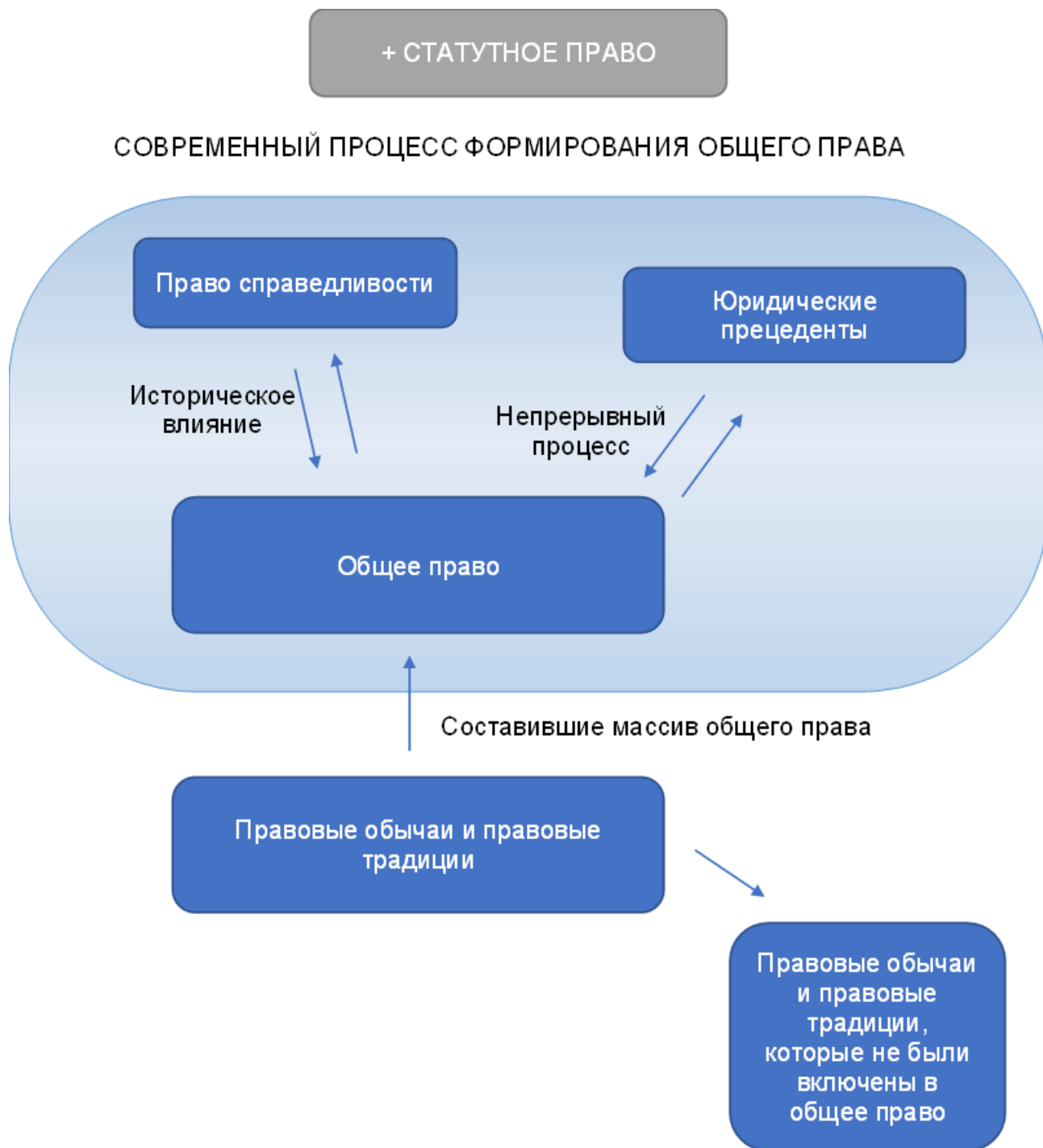
Рис. 2. Генезис системы современного англосаксонского общего права (разработан автором).

«обычное право» конкретно для современной системы англо-саксонского права – это одно и то же. Генезис системы современного англосаксонского общего права представлен на рис. 2.